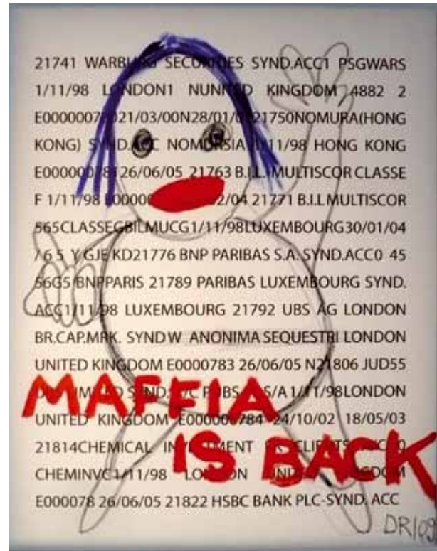
Maffia is back , Denis Robert (162 x 130 cm).